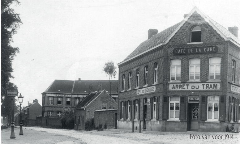
Foto van voor 1914